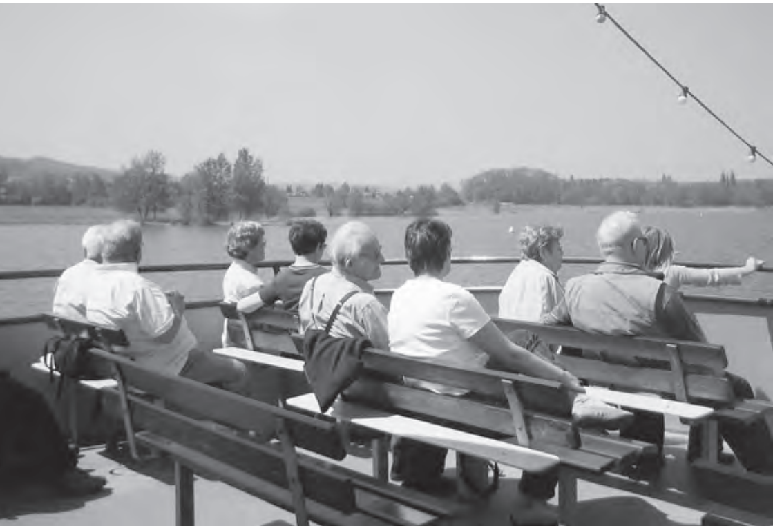
Gemütlicher Nachmittag auf dem Hallwilersee mit unseren Sauerstoffpatienten