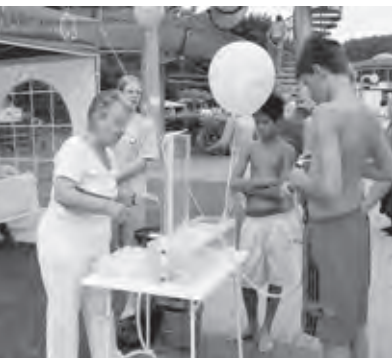
Die Lungenliga Aargau am Brugger Badifest 2006

Leiterin Fachstelle Gesundheitsförderung und Tabakprävention