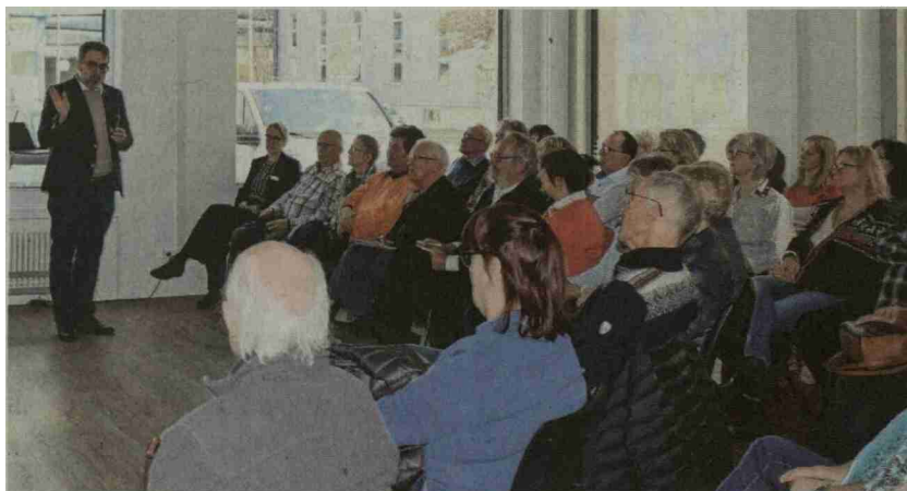
Das Interesse war gross. Über 220 Personen besuchten am Wochenende die Lungenliga Zentralschweiz und die Docstation in Emmen.

Schon seit Ende 2020 hat die Lungenliga Zentralschweiz ihre Geschäfts- und Beratungsstelle in Emmen. Wegen der Corona-Pandemie und der damit einhergehenden Ein-