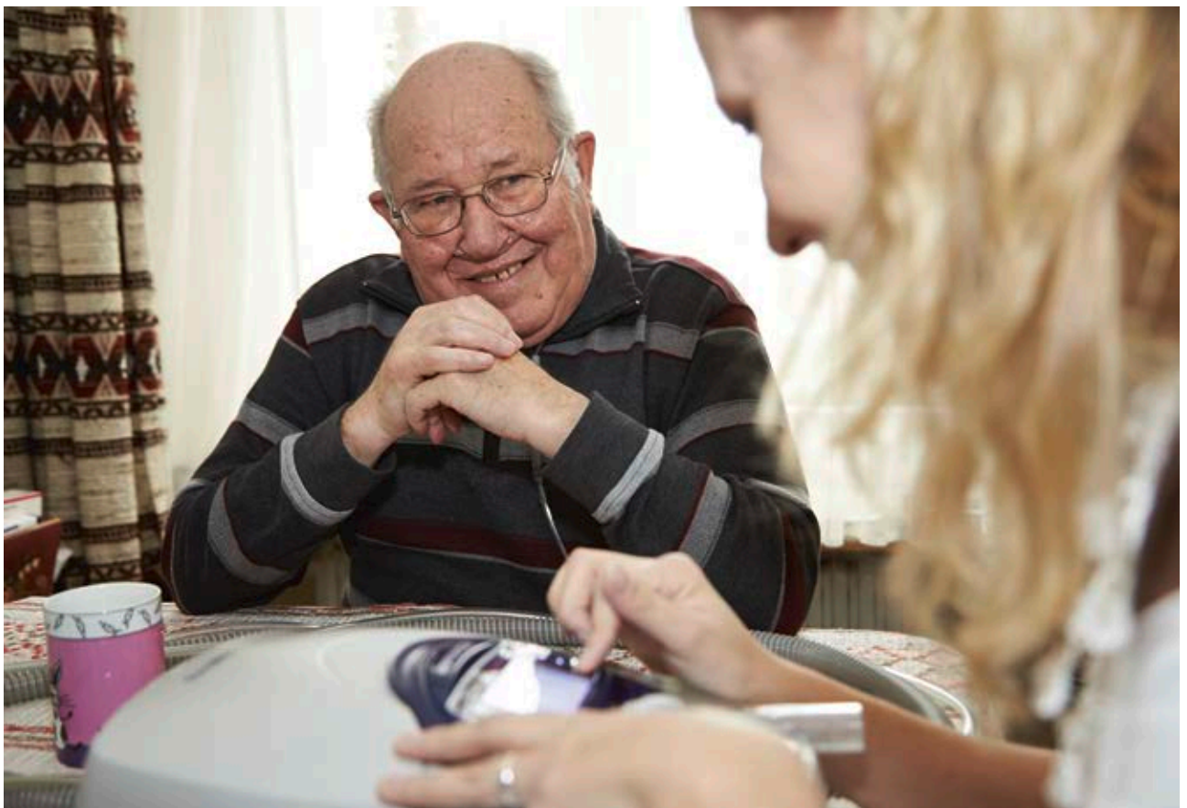
Hausbesuch und Patientenbetreuung durch eine unserer Beraterinnen