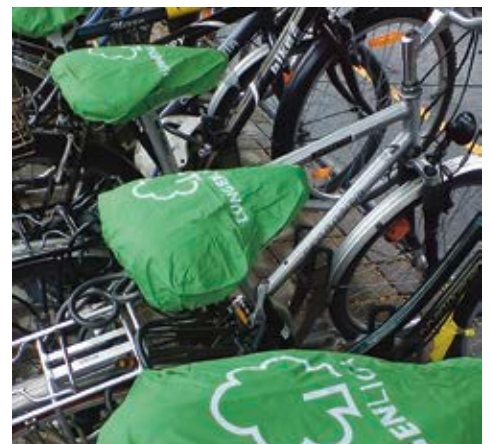
Werbeaktion an den Bahnhöfen Luzern und Zug